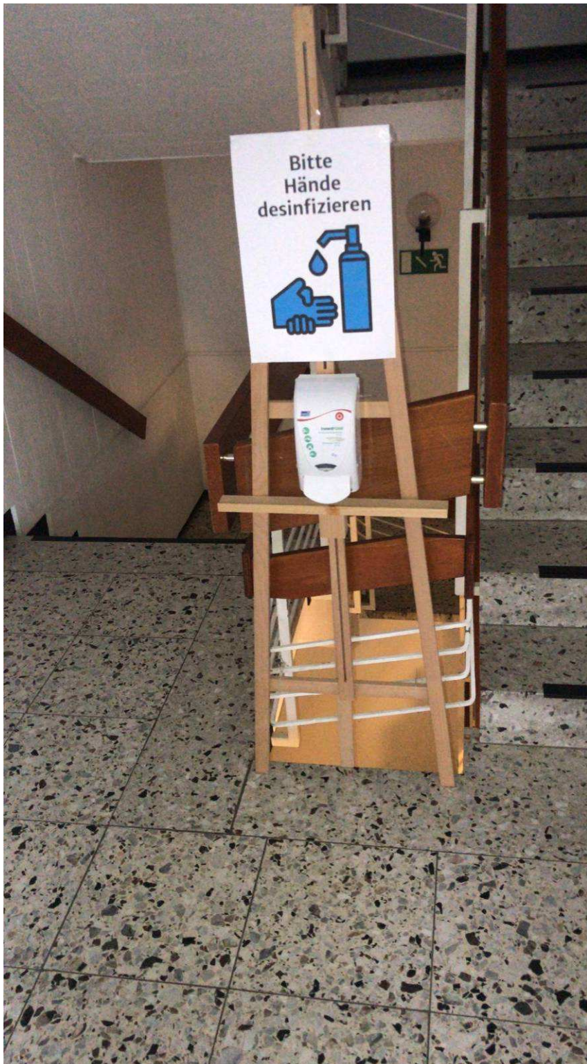
Handdesinfektionsspender im Eingangflur