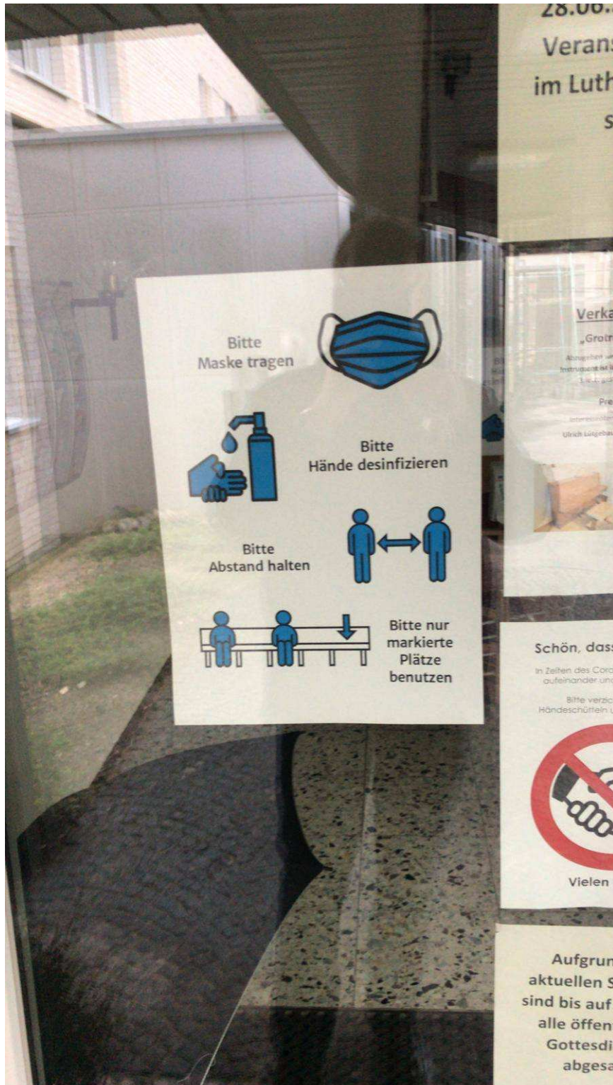
Sicherheitsweise an der Eingangstüre