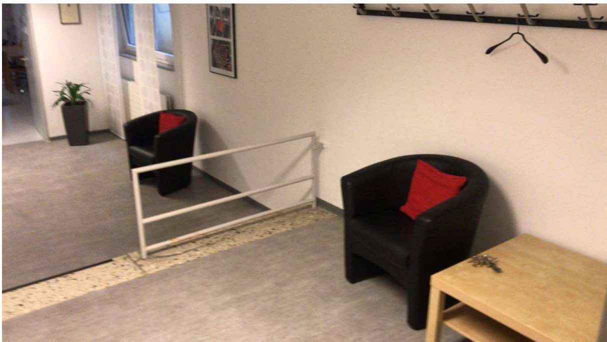
Wartebereich im Untergeschoss